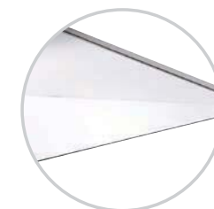
Toit en verre / Glass top