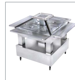
SBC 40 C avec toit motorisé / with motor driven top